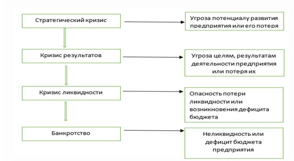
Рис. 4 - Виды кризисов

Кроме того, важно учитывать классификацию основных целей предприятия, которое находится под угрозой в связи с кризисом. Это позволит нам в дальнейшем определить стратегический кризис (рис. 4).