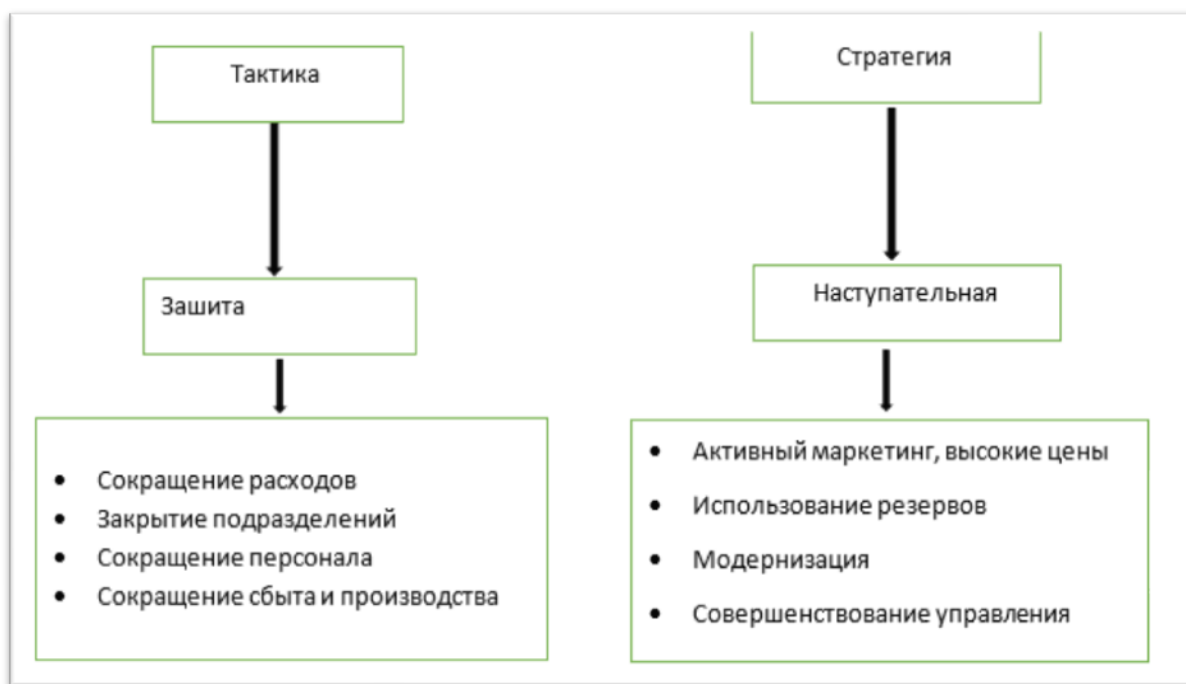
Рис. 5 - Виды восстановительных стратегий

Основной целью стратегий восстановления является быстрое выявление и устранение источников конкурентной и финансовой слабости предприятия. Первая задача антикризисного управления, в данном случае, заключается в анализе и диагностике причин неудовлетворительной работы предприятия. Важно понимать сложность и стратегические задачи, поскольку различные диагнозы могут привести к различным стратегиям выхода (25. - 643 с).