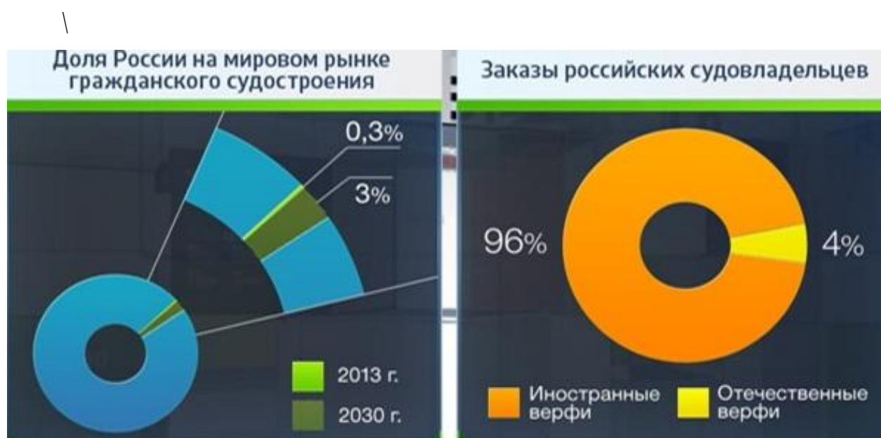
Рисунок 1.1.1 — Доля России на мировом рынке судостроения на 2013 и 2030 годы (слева). Заказы российских судовладельцев (справа)

К примеру, ещё чуть более 20 лет назад отечественное судостроение считалось одним из самых мощных в мире . Только по заказу военно-морского флота было построено и сдано заказчику более 50 единиц, различных боевых кораблей и судов обеспечения. На рисунке 1.1.1 представлена доля нашей страны на мировом рынке судостроения на 2013 и предположительно 2030 годы [1]