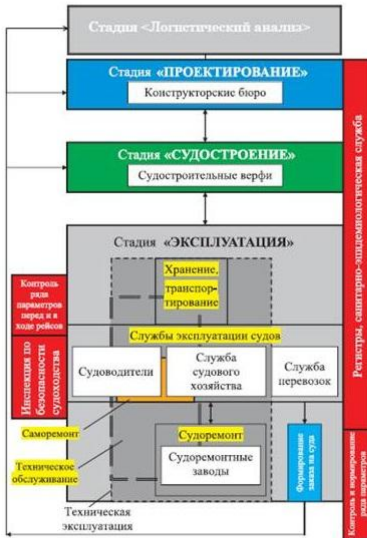
Рисунок 1.3.2 — Этапы жизненного цикла изделий морской техники.

На рисунке 1.3.2 приведены этапы жизненного цикла изделий морской техники. Данная схема отражает взаимосвязи этапов жизненного цикла изделий и заимствована из [7]