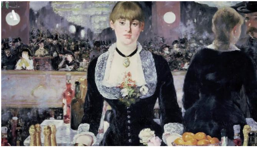
.2 . « - » 1882 .