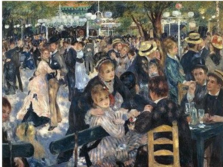
.3 . « » 1876 .