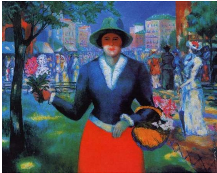
.6 . « » 1903 .