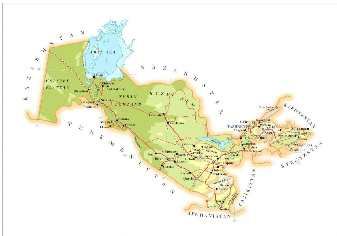
Рис.4 Карта Узбекистана

Природа Узбекистана чрезвычайно разнообразна. Здесь можно найти скалистые горы и знойные пустыни, полноводные реки и засушливые степи. Большая часть территории Узбекистана расположена на Туранской равнине и не отличается резкими контрастами высот. Сформировалась Туранская плита в результате палеозойского горообразования. Долгое время она была покрыта морем. Горные системы окончательно формировались в фазу альпийского горообразования - это горы Тянь-Шаня и Памиро-Алая; продукты разрушения вздымающихся гор выносились на равнины и наслаивались поверх морских отложений (Рис. 4).