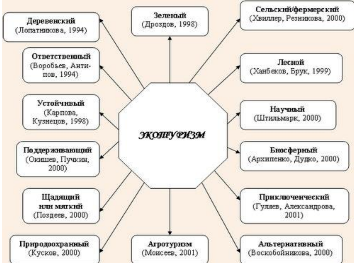
Рис. 1. Виды экотуризма

В процессе развития экологического туризма можно выделить несколько позитивных тенденций: