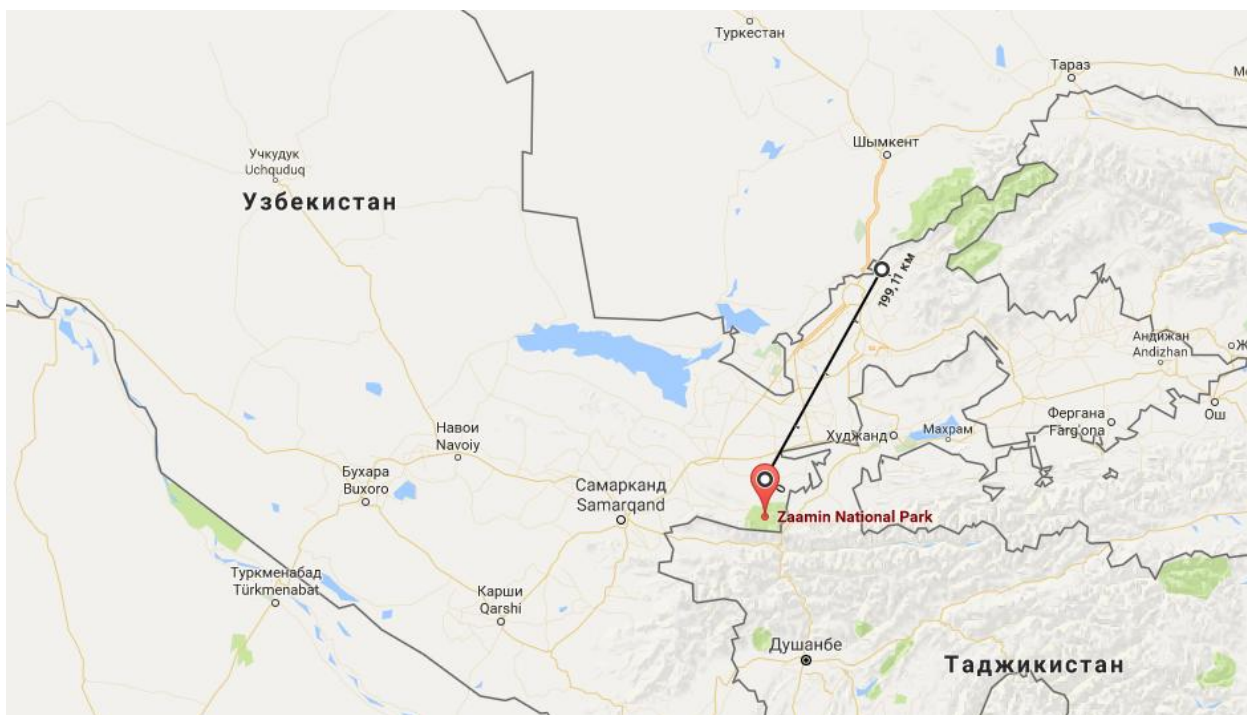
Рис.6 Национальные парки Узбекистана

Угам-Чаткальский государственный национальный природный парк был создан в 1992 году на базе Чаткальского биосферного заповедника, расположенного в отрогах Чаткальского хребта Западного Тянь-Шаня, с присоединением к нему Ахангаранского, Бричмуллинского и Чирчикского лесхозов. Сегодня его площадь составляет 668 тысяч 350 гектаров и он является крупнейшим природоохранным комплексом Узбекистана [15].