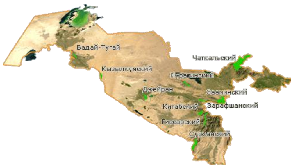
Рис. 5 ООПТ Узбекистана