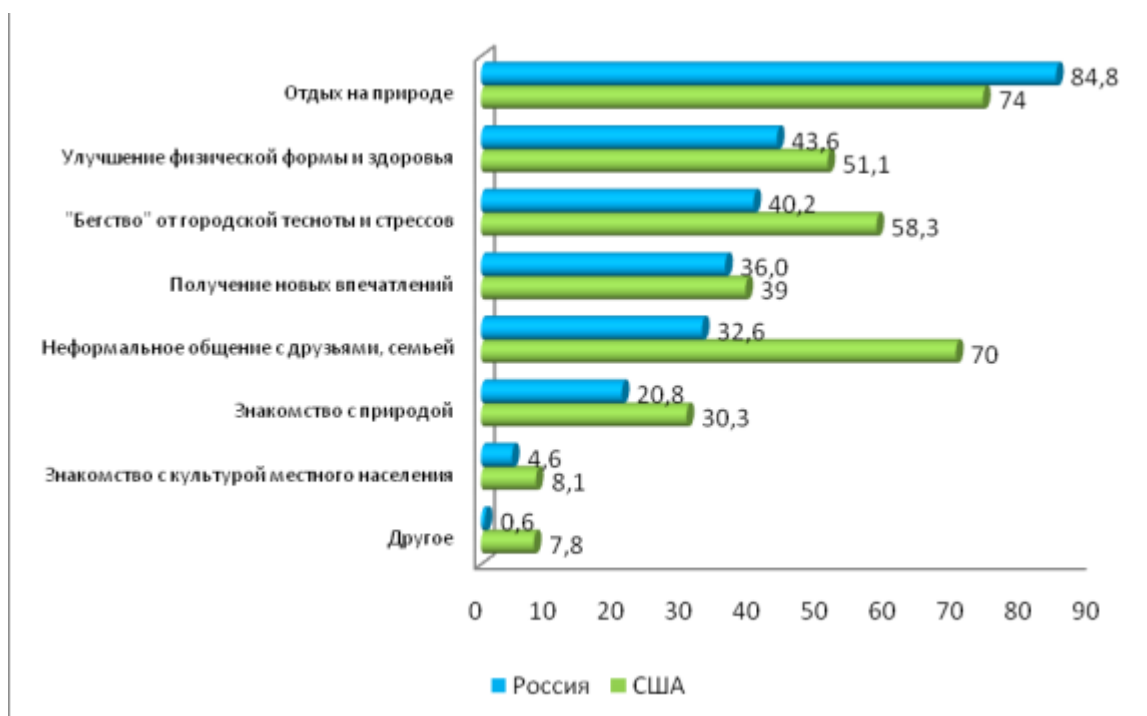
Рис.3 – Гистограмма распределения ответов студенческой молодежи России и США на вопрос: «Как бы Вы оценили основную цель данных поездок?», в % (n=1100)

Результаты проведенного исследования обозначили перечень проблем, которые требуют своего решения, что в свою очередь позволит в большей степени реализовать возможности экотуризма. Эта задача государственного масштаба.