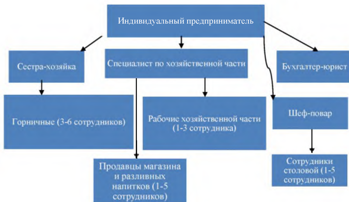
Рисунок 2.1- Организационная структура управления в Отеле «Диана»

Имеется ввиду количество сотрудников: если в начале и конце курортного сезона численность минимальна (это май, начало июня, вторая половина сентября, октябрь, редко начало ноября), то, начиная со второй половины июня явно прослеживается тенденция планомерному росту до конца августа. В межсезонье спросом пользуются периодически объекты банного комплекса, поэтому, в основном, справляется сам индивидуальный предприниматель, специалист по хозяйственной части, редко сестра-хозяйка и шеф-повар. Работа бухгалтера-юриста имеет круглогодичный характер.