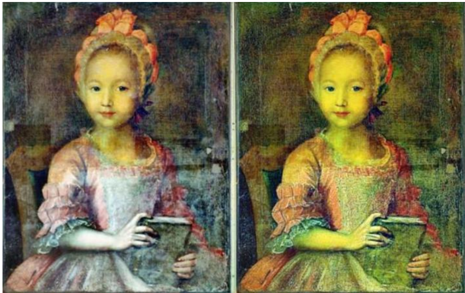
Рисунок 2. Исходное изображение "Портрет девочки в розовом", Неизвестный художник, из фондов Государственного Русского музея размером 682 на 872 пикселя - (а). Результат обработки исходного изображения: метод DarkChannelPriorStatistics (DCPS) - (б). Результат обработки исходного изображения: метод ContrastLimitedAdaptiveHistogramEqualization (CLAHE) - (в). Результат обработки исходного изображения: комбинация методов CLAHE и DCPS - (г)