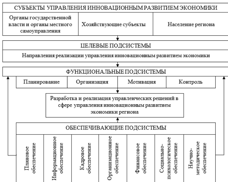
Рисунок 2.3. Структурная схема управления инновационным развитием экономики на мезоуровне .

В Российской Федерации управление развитием хозяйственных систем на мезоуровне в условиях формирования экономики инновационного типа осуществляется федеральном и региональном уровнях. Управление на федеральном уровне включает в себя формирование государственных структур, регулирующих развитие инновационного потенциала, сфер и механизмов инновационной деятельности, разработку инвестиционной и льготной налоговой политики, создание нормативно-правовой базы.