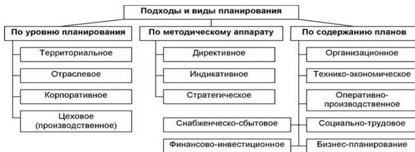
Рис. 2.1. Подходы и виды планирования

администрирования и сосредоточения всех функций планирования в руках единого субъекта управления. Особенность - комплексность, механистичность.