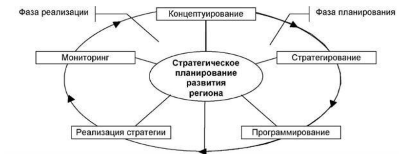
Рис. 2.2. Схема стратегического планирования развитием региона («малый» управленческий цикл)

На этапе программирования осуществляется построение и обоснование комплекса конкретных мероприятий, проектов и тактических средств достижения стратегических целей, конкретизация и корректировка стратегических направлений социально-экономического развития региона. Кроме того, на данном этапе осуществляется выявление и анализ проблем в развитии региона, формулировка конкретных задач, путей и механизмов их решения. Реализация контрольных и аналитических функций в системе стратегического планирования развития региона осуществляется в ходе мониторинга. С помощью этого инструмента осуществляется, во-первых, отслеживание реализации намеченной стратегии развития, во-вторых, корректировка изначально сформулированных стратегических целей в процессе их практического воплощения. Таким образом, в рамках стадии планирования регионального развития можно также выделить «малый» управленческий цикл, включающий в себя все вышеописанные этапы (рис. 2.2).