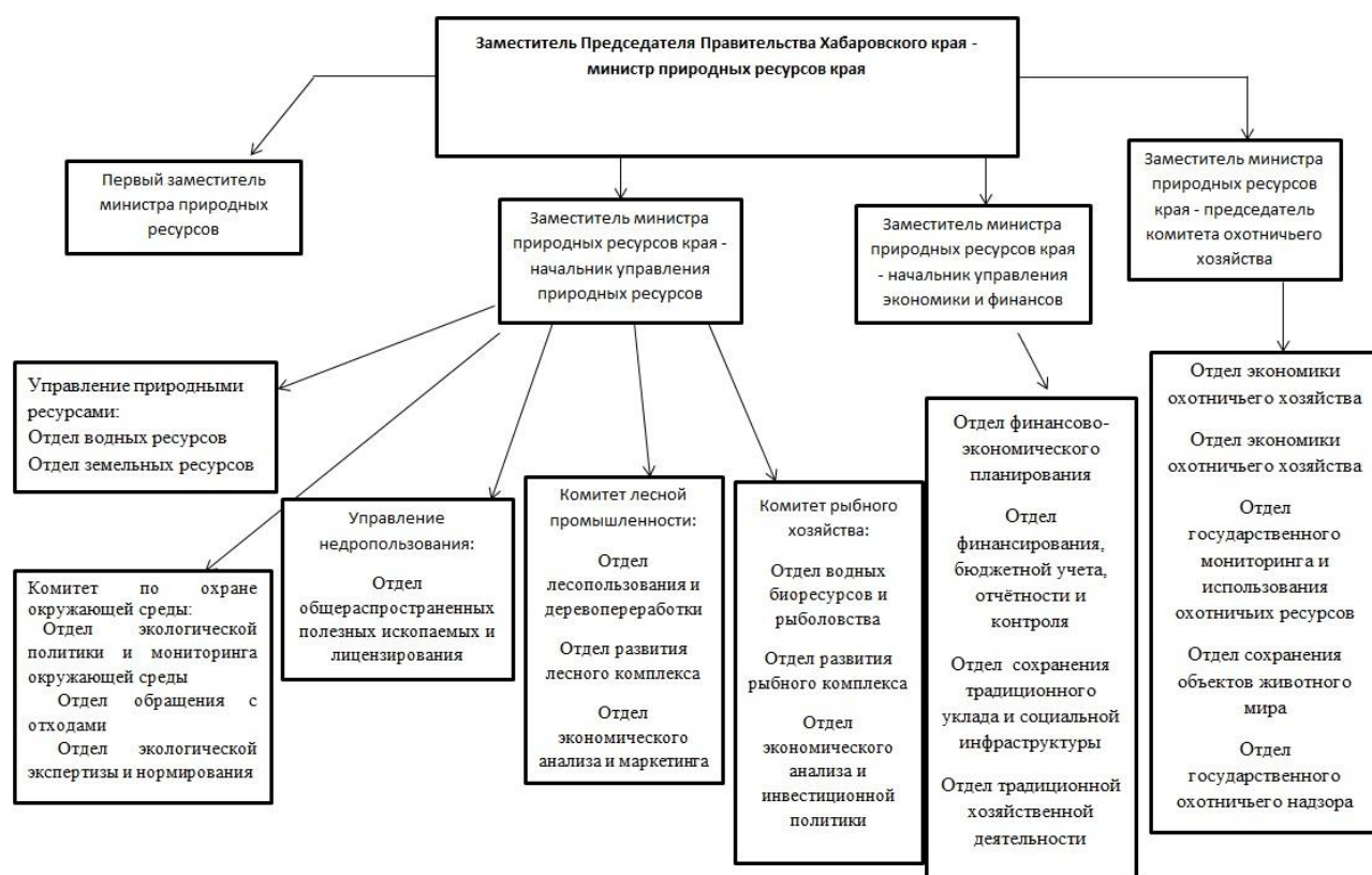
Рис. 2 Структура Министерства Хабаровского края